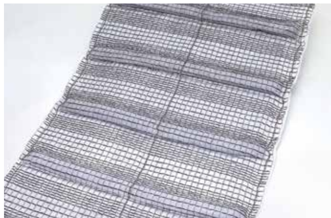
※写真はロンケット DX 3型です。