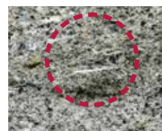
従来製品 (PP樹脂) 使用