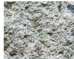
バサロン ファイバー使用