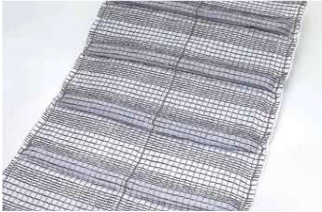
※写真はロンケット DX 3型です。