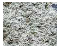
バサロンファイバー使用