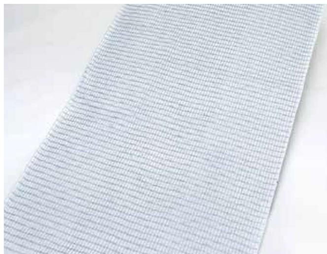
※写真はロンケット ネット 1m巾です。