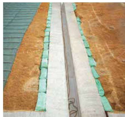
埋戻しまくらグリーンバッグ工