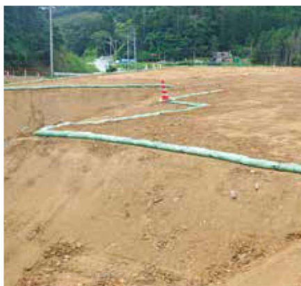
法肩まくらグリーンバッグ工