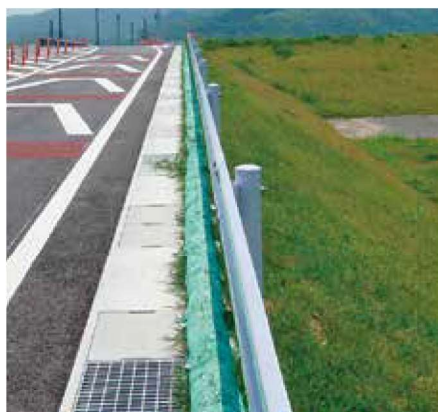
法肩まくらグリーンバッグ工