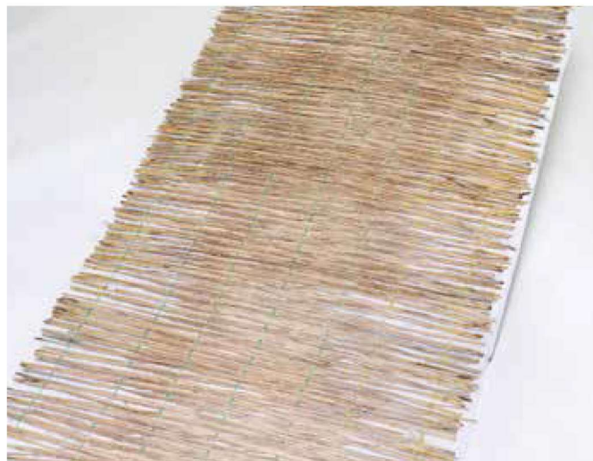
※写真はロンケット ワラです。