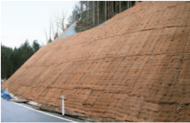
飽海中央地区広域営農団地農道整備事業5工区工事(山形県)