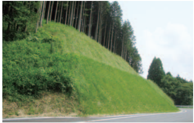
町道大久保米ノ山線第4期改良工事(熊本県)