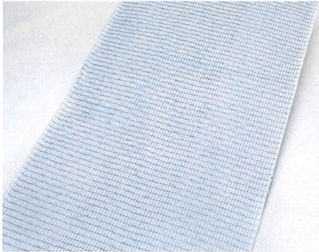
※写真はロンケット ネット 1m巾です。