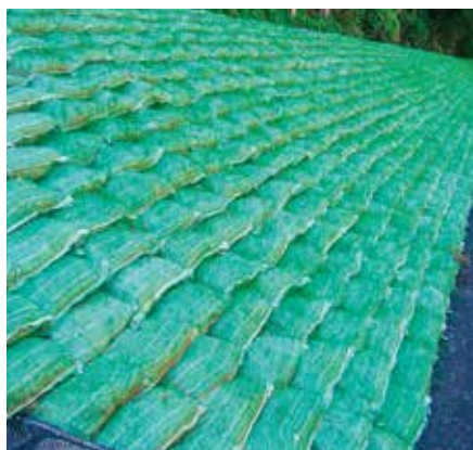
土留グリーンバッグ工