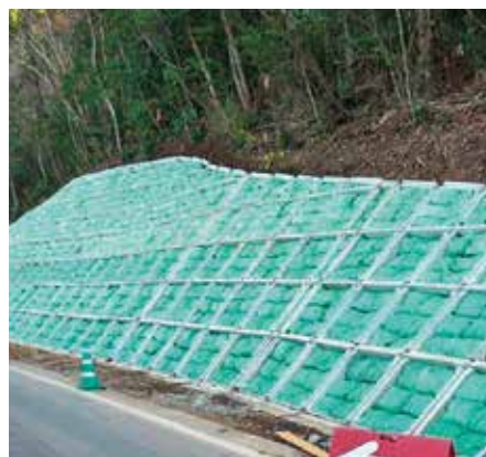
法枠グリーンバッグ工