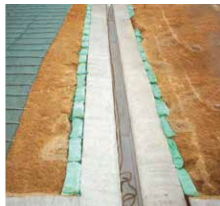
埋戻しまくらグリーンバッグ工