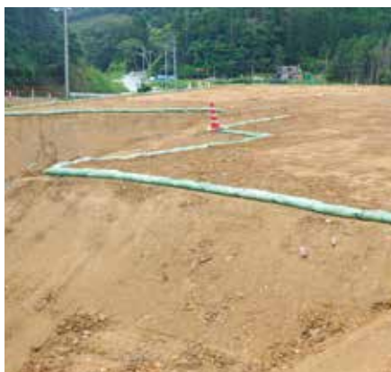
法肩まくらグリーンバッグ工