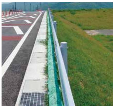
法肩まくらグリーンバッグ工